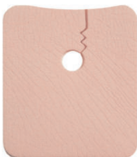
REF 958 (groß)